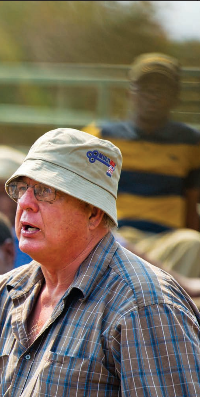
er leer hy hulle alles wat 'n beesboer behoort te weet.

Bron: Universiteit van Wes-Kaapland se program vir grond-en-landbouhervorming (Plaas)