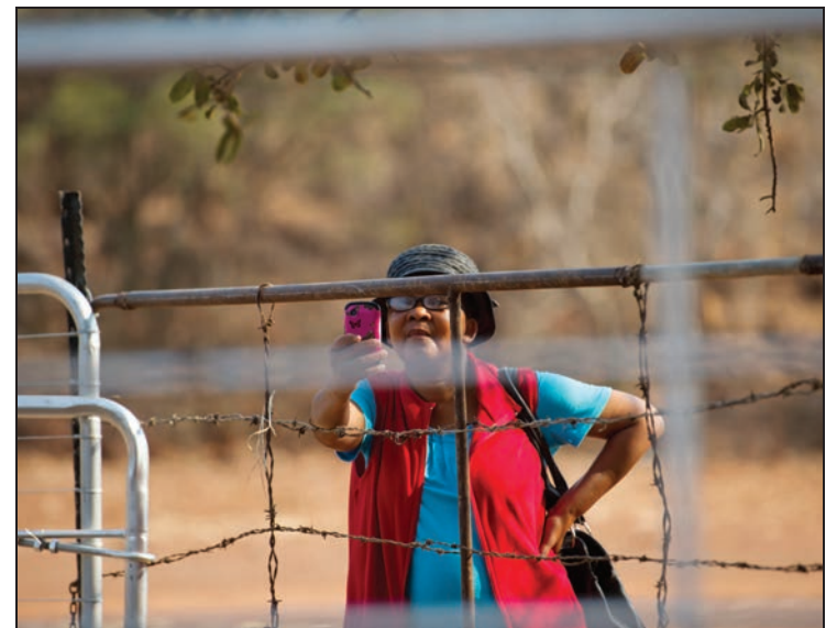
Bo en regs: Dié vrou is deel van 'n groep vroueboere wat op gehuurde grond van die Royal Bafokengstam sowat 25km van Rustenburg met vee boer.

het gehelp om 'n siek dier of 'n koei wat moeilik kalf deur te trek.